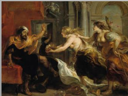
Рубенс, Пиршеството на Терей 1636, Мадрид, Прадо