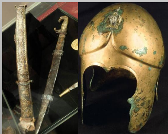
Гробницата на Севт, III, могила Голямата Косматка (III в. пр. Хр.)