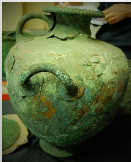
Бронзова хидрия, Пловдив