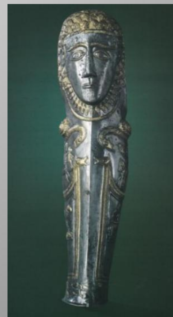
Гробница на аристократ от IV в. пр. Хр. (Златиница, Голямата могила)