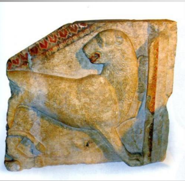
Жаба могила, V - IV в. пр. Хр., София