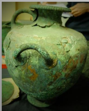
Бронзова хидрия, Пловдив 1540, 0,373 x 0,315 м.