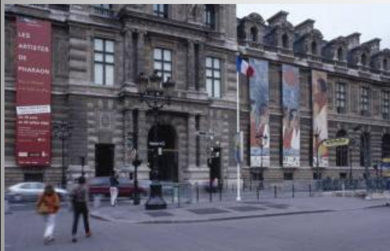
Поставяне на афиши на музея Лувър, ул. Риволи, Париж