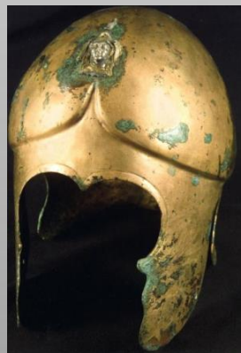
Шлем с надпис