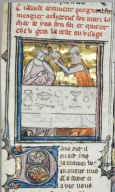
Национална библиотека на Франция, Отмъщението на Прокна

Развитието в изобразяването на тракийските митове ще въведе представянето на античните експонати.