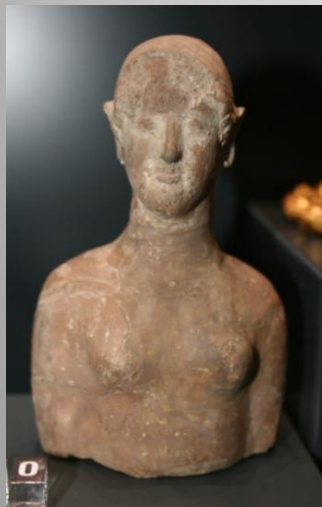
Протоме от глина, Пловдив