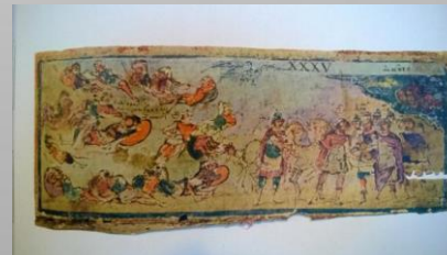
Убийството на Рез, Библиотека Амброзиана